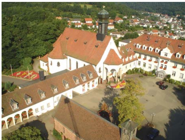
Wallfahrtsort Maria Rosenberg Gnadenkapelle im Vordergrund