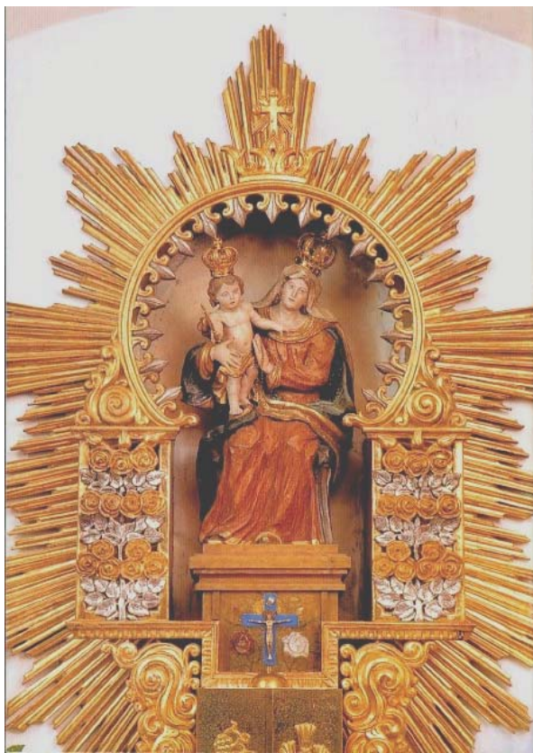
„Die Mutter mit dem göttlichen Kind“ Gnadenbild von Maria Rosenberg